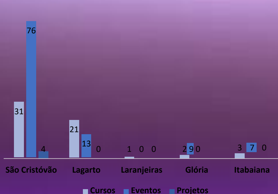
Gráfico 1: Número de Ações por Campi